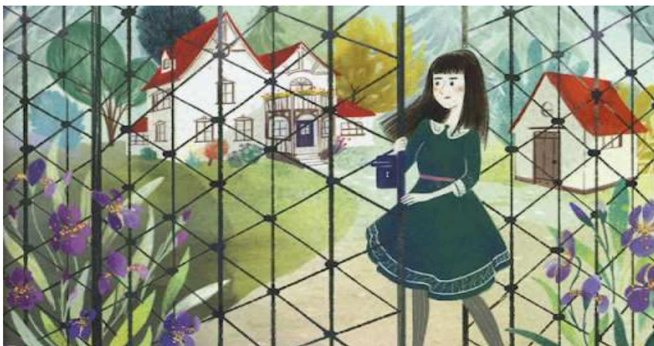
Immagine tratta da “A un passo da un mondo perfetto”, Palumbo Daniela, Piemme, 2019

Per scoprire tutte le proposte di lettura, venite in biblioteca. I nostri consigli di lettura sono in distribuzione al banco del prestito.