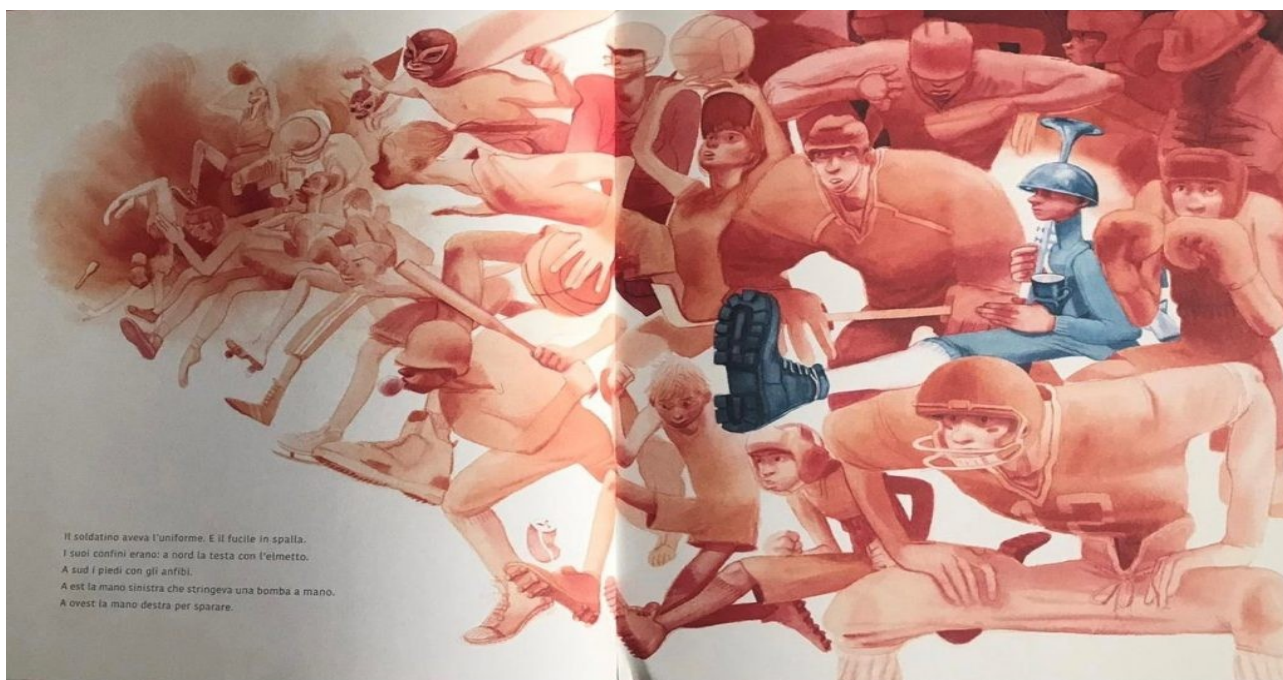
Immagine tratta da "Il soldatino", Zoolibri, 2020

Proposte di lettura tra i nuovi libri arrivati alla Biblioteca De Amicis