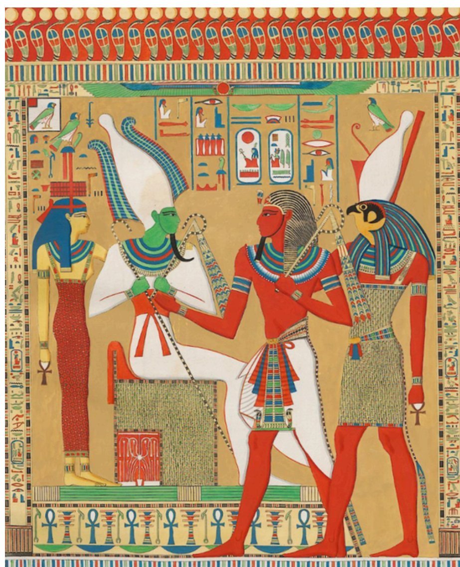
I monumenti dell’Egitto e della Nubia, Ippolito Rosellini, 1832 (Biblioteca Berio)

Proposta di lettura a tema nello spazio Berioldea dal 21 maggio