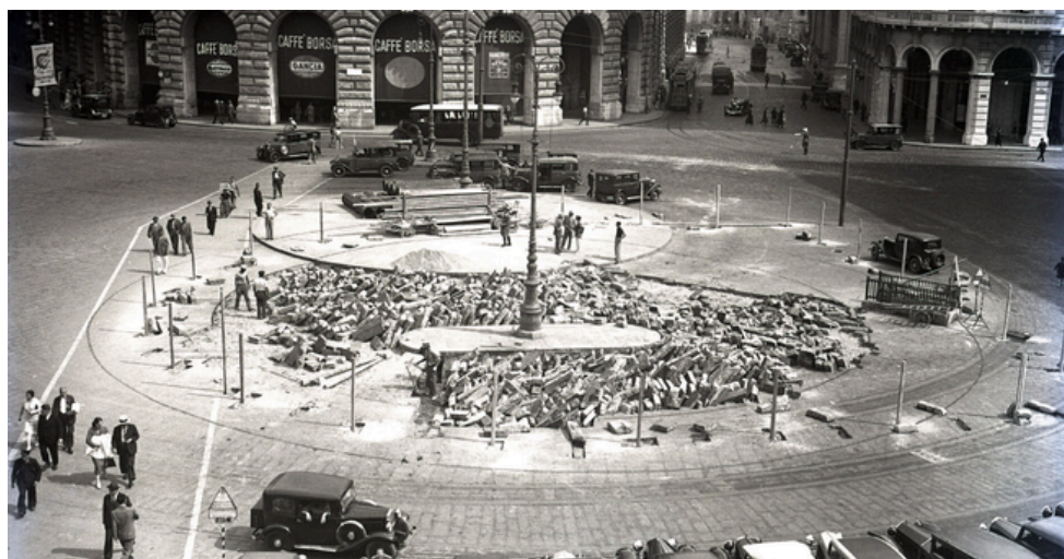
Piazza De Ferrari, Lavori per la costruzione della fontana, 1935