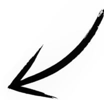
Immagine tratta da "100 attività Montessori" Eve Herrmann, L'Ippocampo Ragazzi

..il gioco può essere proposto ispirandosi ad una delle attività Montessori dedicate alla conoscenza delle gradazioni cromatiche.