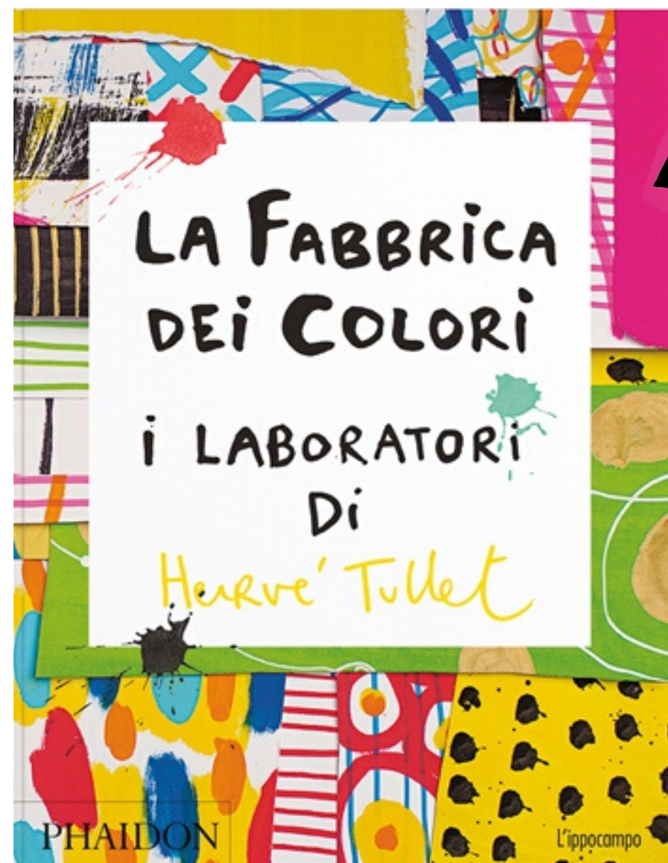
LA FABBRICA DEI COLORI i LABORATORI Di Hervé Tullet