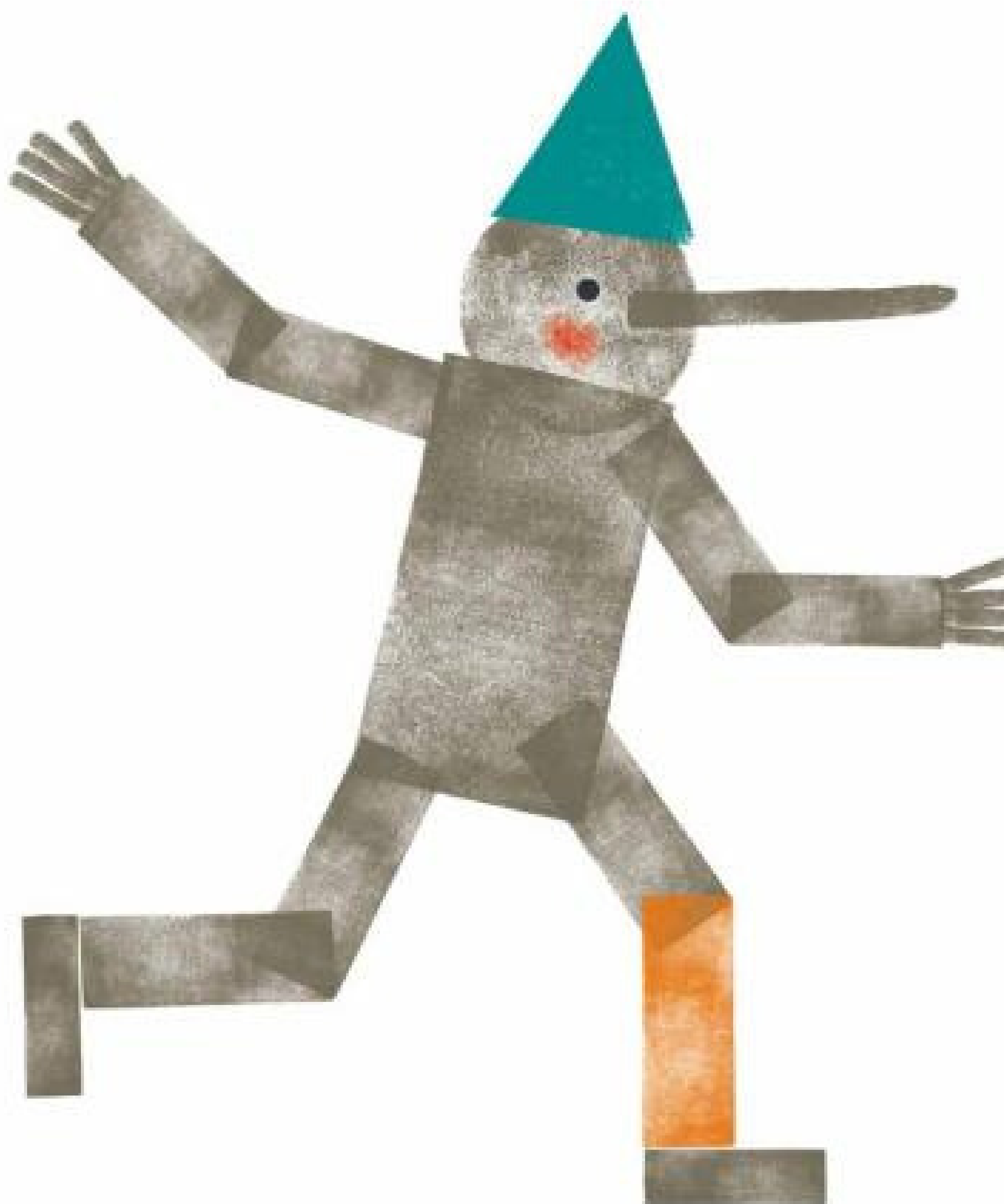
immagine tratta da "In ogni Pinocchio" (Topipittori 2016)